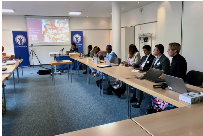
Mitglieder des Internationalen Rates der ISHR während des Treffens

In Bonn, wo sich auch das Sekretariat der ISHR befindet, kamen die Leiter der Sektionen aus sechs Kontinenten (Albanien, Kenia, Mali, Litauen, Weißrussland, Deutschland, Moldawien und Aserbaidschan) zusammen. Zudem nahmen auch einige Mitglieder, die nicht persönlich anwesend sein konnten, online an der Veranstaltung teil. Es war die erste Sitzung des Internationale Rat der ISHR seit dem Ausbruch der Covid-19-Pandemie im Jahr 2019.