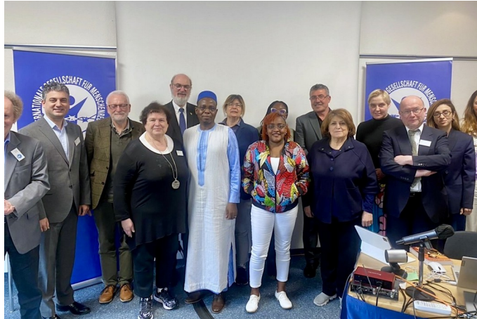
Mitglieder des Internationalen Rates der ISHR während des Treffens