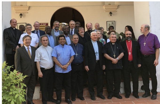
Der Ausschuss des Globalen Christlichen Forums in Kuba 2017

Prince erhielt drei akademische Ehrenerkennungen: Doktor der Theologie im Jahr 1980, Doktor der Literaturwissenschaften im Jahr 1984 und Doktor der Rechtswissenschaften im Jahr 2000. In Anerkennung seiner Verdienste wurde er vom König von Malaysia mit zwei