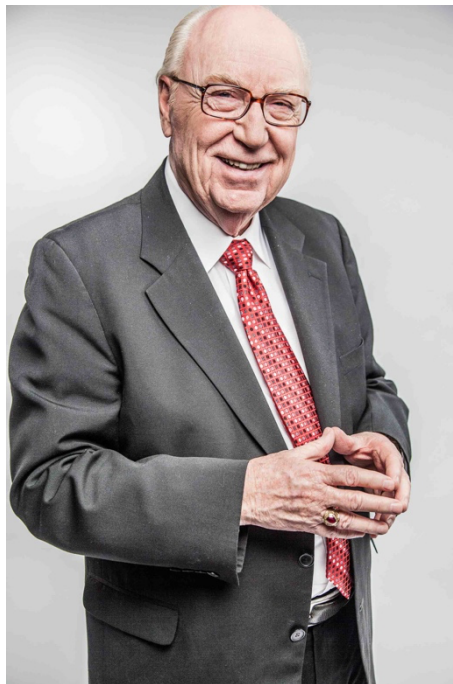
George O. Wood

„George Wood besaß die erstaunliche Fähigkeit, seinem christlichen Glauben und seiner Pfingsttheologie treu zu bleiben und gleichzeitig die Meinungen und Überzeugungen anderer anzuhören und zu respektieren. Bei der Anmeldung zur jährlichen Klauertagung der konfessionellen Leiter des NAE fragten die Leiter anderer