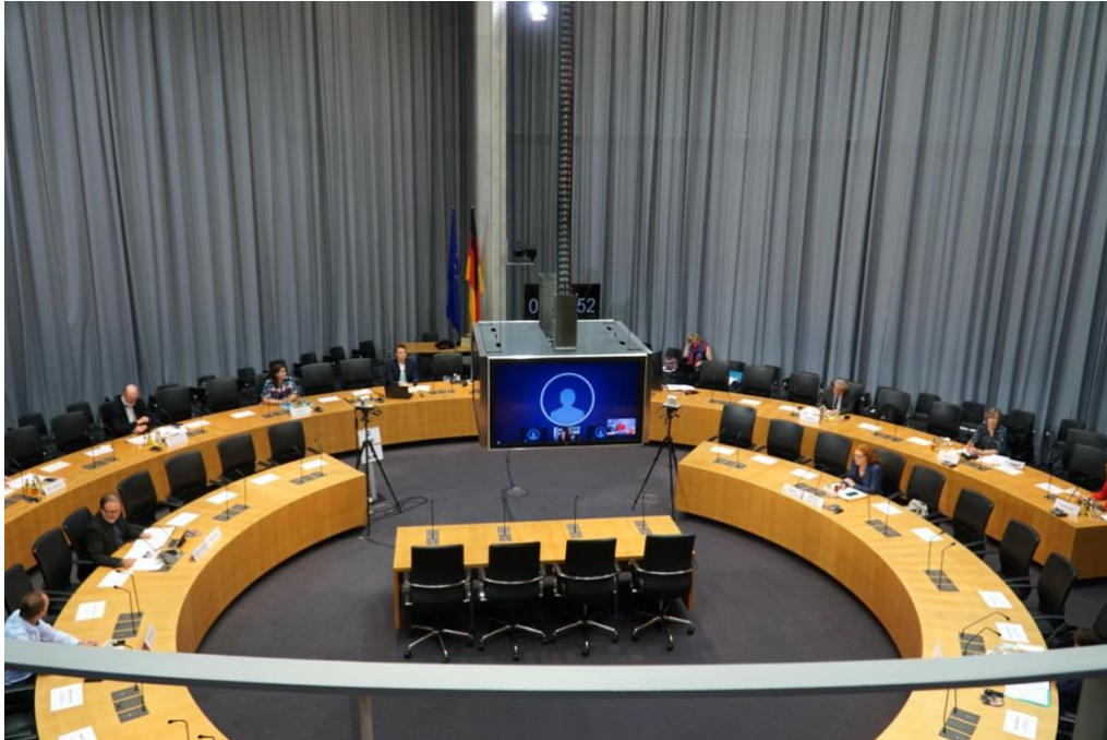
Blick in die Runde des Menschenrechtsausschusses unter Coronabedingungen